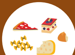
RESTES DE REPAS ET LAITAGES