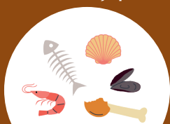
VIANDES, POISSONS ET COQUILLAGES