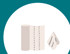
MOUCHOIRS, ESSUIE-TOUT, LINGETTES