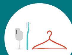
PETITS OBJETS (STYLOS, VAISSELLE CASSÉE, BROSSA À DENTS...)