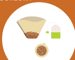
SACHETS DE THÉ, MARC DE CAFÉ