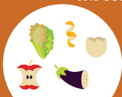
ÉPLUCHURES, COQUILLES D'ŒUF, FRUITS ET LÉGUMES ABÎMÉS

dans la BORNE BIODÉCHETS (toujours dans un sac kraft) et le COMPOSTEUR :