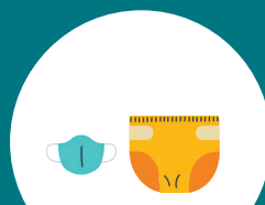
ARTICLES D'HYGIÈNE (MASQUES, COUCHES)